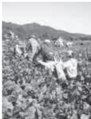
大豆「借金なし」枝豆の収穫

地元産農産物の消費拡大は、農業者を地域内で支え、あわせて農地を活かし、環境保全効果もあります。市民の皆さんも地元産の農産物消費を心がけましょう。